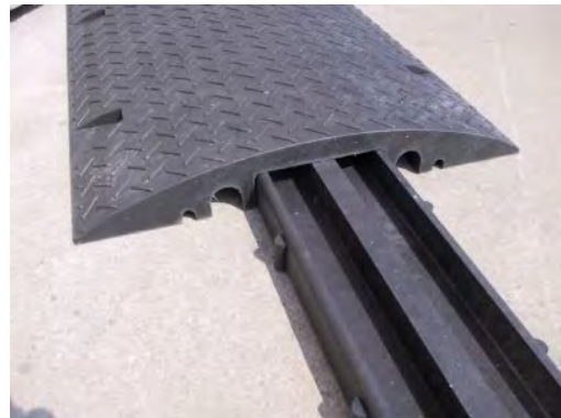
Kabelkanäle: 2 mit 55 x 35 mm 2 mit Ø 15 mm 2 mit Ø 35 mm