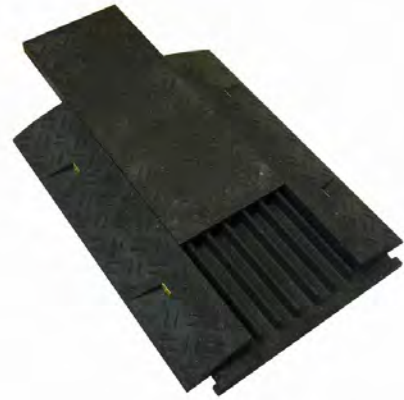
Kabelkanäle: 5 mit 35x35mm