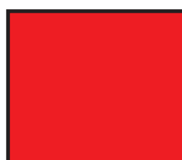
Rot RAL 3001 Signalrot