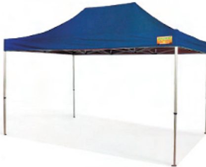
Zeltgröße 3,0 x 4,5 m Packmaß: 29 x 45 x 156 cm Gewicht: ca. 26 kg