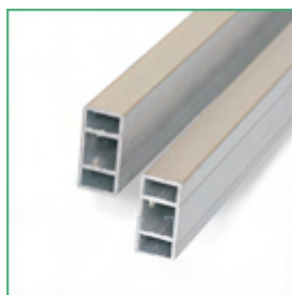
Doppelsteg in der Dachverstrebung