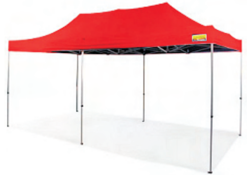
Zeltgröße 3,0 x 6,0 m Packmaß: 35 x 62 x 164 cm Gewicht: ca. 42 kg