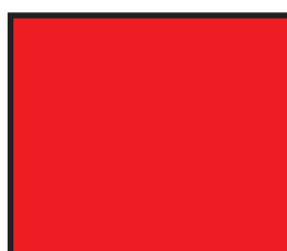
Rot RAL 3001 Signalrot