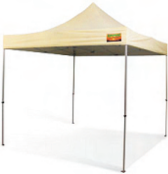
Zeltgröße 3,0 x 3,0 m Packmaß: 35 x 35 x 164 cm Gewicht: ca. 26 kg