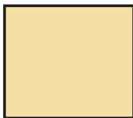
Sand RAL 1015 Hellelfenbein