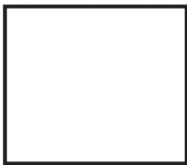
Weiß RAL 9016 Verkehrsweiß

Die Farbdarstellungen können je nach Monitor und Drucker erheblich abweichen. Um ihnen eine bessere Vorstellung der Farben zu ermöglichen, haben wir alternative Farbbezeichnung angegeben.