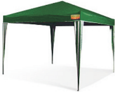
Zeltgröße 3,0 x 3,0 m Packmaß: 24 x 24 x 125 cm Gewicht: ca. 15 kg