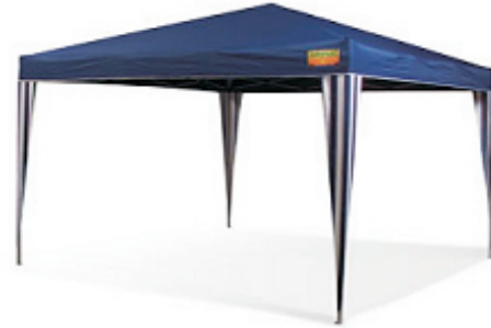
Zeltgröße 3,0 x 4,0 m Packmaß: 24 x 26 x 130 cm Gewicht: ca. 17 kg