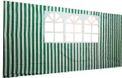
4,0 m mit Fenster

Für die 6,0 m Seite werden 2 Seitenwände á 3,0 m benötigt.